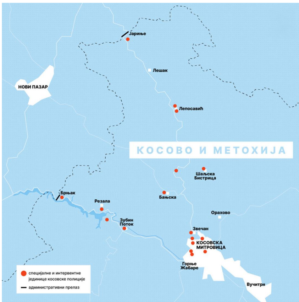
Мапа 1. Оквирни приказ присуства косовских полицијских снага на Северном Косову 18

mestima (Zubin Potok, Severna Mitrovica, Zvečan, Banjska, Leposavić). Orijentacije radi, reč je o teritoriji ukupne površine oko 1.006 km 2 , na kojoj prema svim procenama ne živi više od 50.000 stanovnika, pa se može zaključiti da se radi o nesrazmerno velikom prisustvu bezbednosnih snaga za tako malu i relativno retko naseljenu teritoriju, i to raspoređenom na svim glavnim putnim pravcima, kao i u svim većim naseljenim mestima.